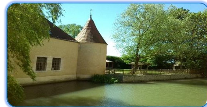
A crédit : Christian. D.